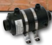
HF 13 - 13кВт