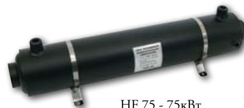
HF 75 - 75кВт