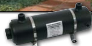
HF 40 - 40кВт