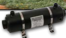
HF 28 - 28кВт